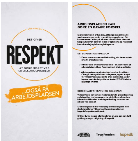
2-siders flyer med henvisninger til hvor ledelse og medarbejdere kan få vejledning og hjælp