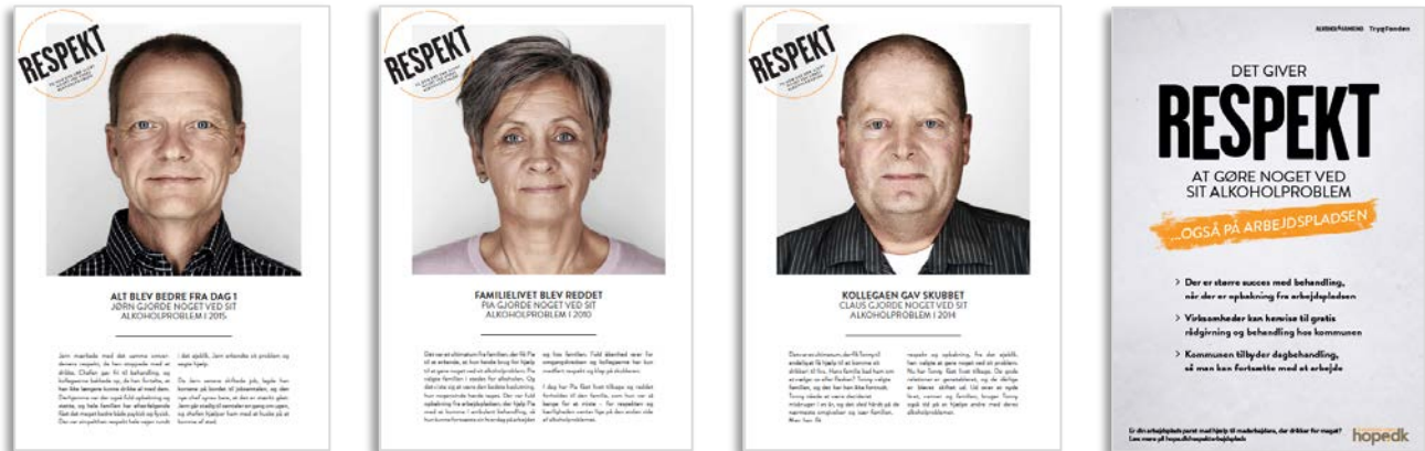
Respekt eventplakater. 70 x 100 cm. Kan også printes på A3-papir