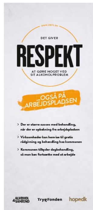
Roll up med fakta