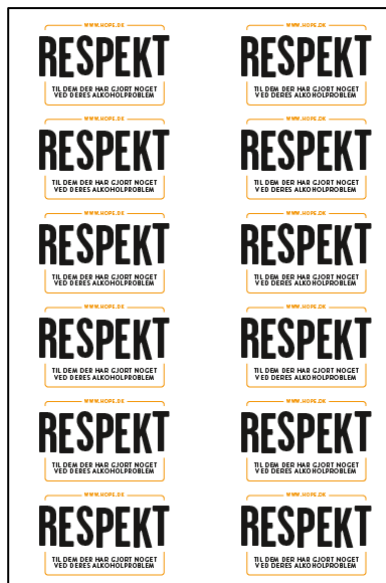
A4 labelark med Respekt eventklistermærker, klar til at printe.